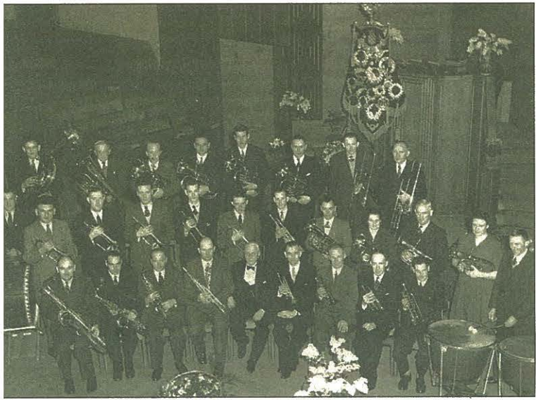
christelijke harmonievereniging Crescendo in de Julianakerk in de jaren tigtig van de vorige eeuw.