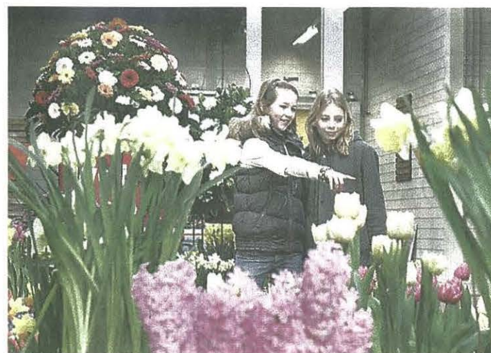
Kleurige, 'stugge' bloemen maken de meeste kans op de hoofdprijs

„Het is zeker geen abc'tje. Je moet rekening houden met de weersomstandigheden en de verschillende soorten bloemen. De broeiers hebben onder meer tulpen, hyacinten en narcissen mee-