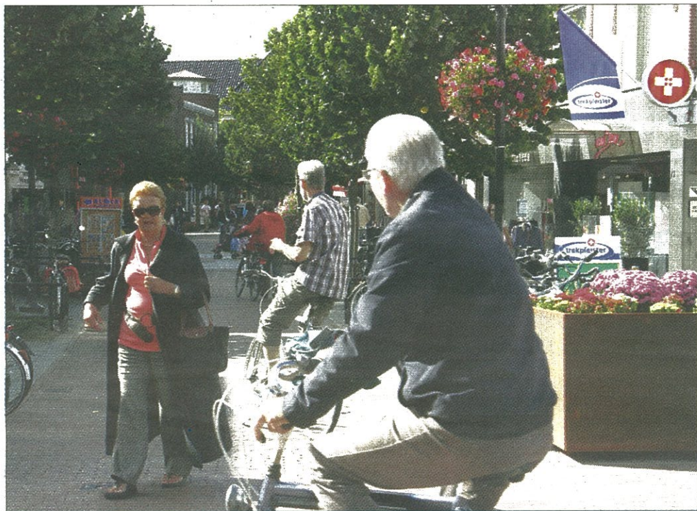
Mogelijk komt er in de Kanaalstraat een fietsverbod op gezette tijden.

LISSE - Als de fracties van het CDA, VVD, D66 en SGP-CU ligt, komt er mogelijk een fietsverbod.