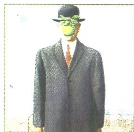
Kunst bij BIB.

HILLEGOM - In BIB Kunstschoor (Leidsestraat 278), op de grens van Lisse en Hillegom, wordt viermaal een kunst-documentaire op een groot scherm vertoond. De eerste keer gebeurt dat vrijdag 24 januari vanaf 20.30 uur.