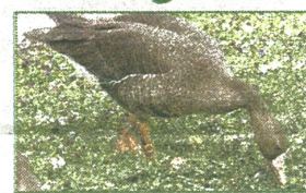
Wilde gans.

LISSE - Natuurvereniging De Bollenstreek, een afdeling van de Koninklijke Nederlandse Natuurhistorische Vereniging (KNNV), biedt zaterdag 25 januari een wandeling op diverse plaatsen in Noord-Hollands gebied.