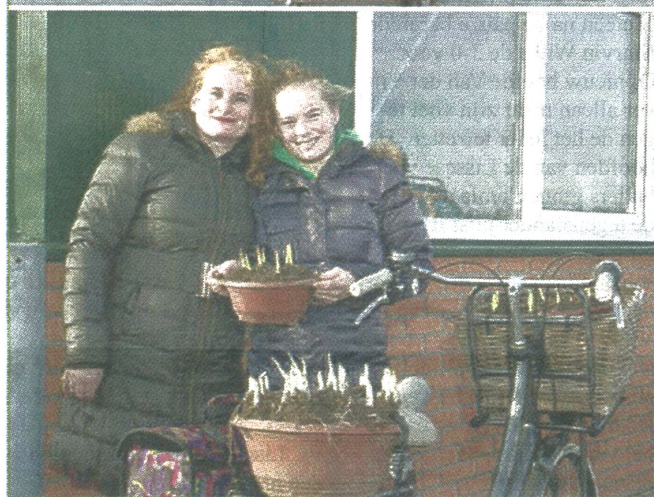
Deelnemers aan de huisbroei voor de Lenteflora tonen bij P. van Dijk de potten waarmee ze aan de slag gaan.

LISSE - De deelnemers aan de huisbroei verbonden aan de Lenteflora hebben hun potten opgehaald bij P. van Dijk (Achterweg-Zuid 72a). Dat kon zaterdag 18 januari. De bloemententoonstelling wordt van vrijdag 14 tot en met maandag 17 februari gehouden bij Praktijkonderzoek Plant & Omgeving ofwel PPO (Prof. van Slogterenweg 2).