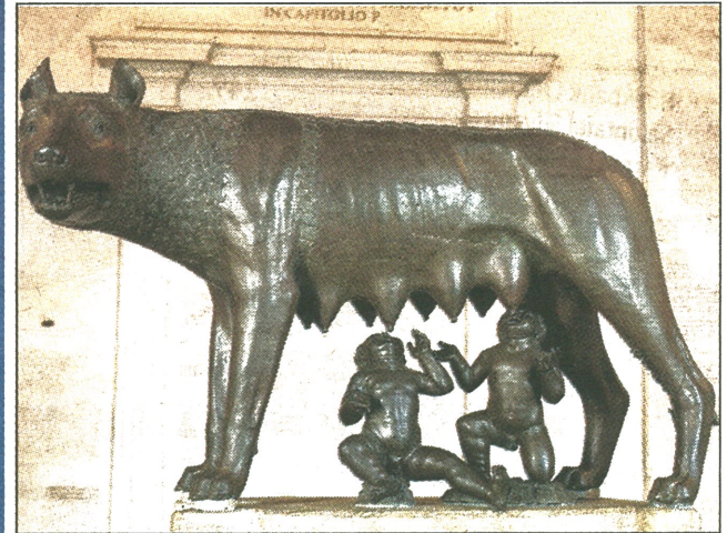
De Lupa Capitolina of Capitolijnse wolvin, die de tweeling Romulus en Remus, de stichters van Rome, zoogt.