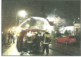
Brand in de Berkhoutlaan.