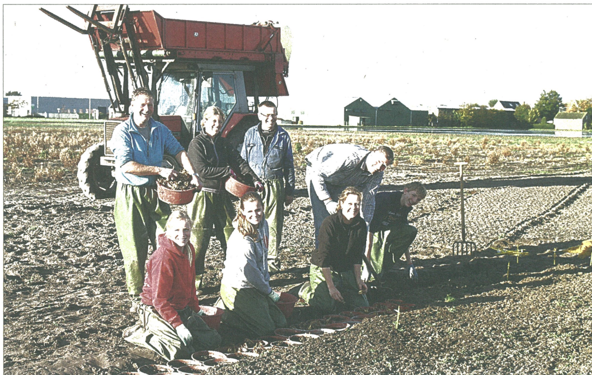
De eerste bollen voor de huisbroei worden geplant.

Lisse n De Historische Vereniging Oud Lisse houdt op dinsdag 4 november tussen 9.00 en 12.00 uur de maandelijkse algemene inloopochtend in de Vergulde Zwaan, 1ste Havendwarsstraat 4. Er zijn een aantal vrijwilligers van de diverse werkgroepen aanwezig, onder andere genealogie, fotoarchief, bouwkunde, geschiedenis, heemkunde. De Vereniging heeft ook belangstelling voor, geschriften, foto's en voorwerpen die met de geschiedenis van Lisse en directe omgeving te maken hebben. Nadere informatie op www.oudlisse.nl per e-mail: info@oudlisse.nl