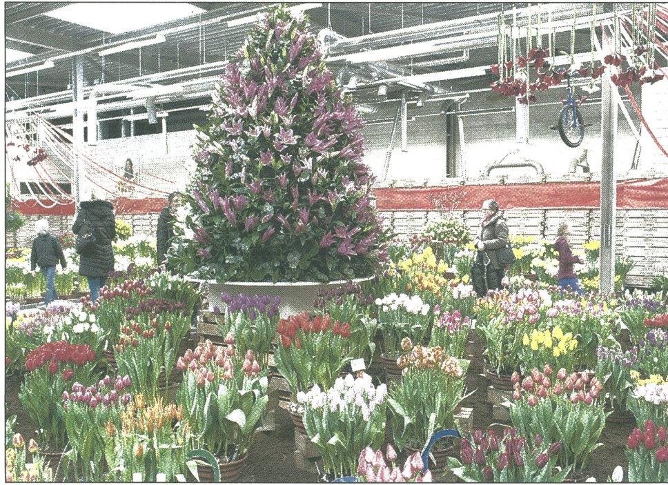
Bloemenpracht van de 82ste Lenteflora in het gebouw van HoBaHo.