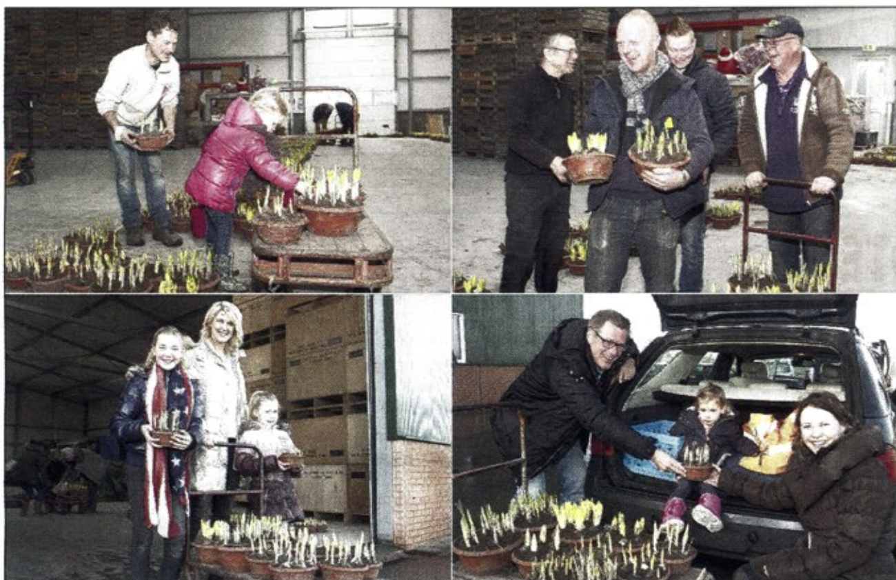
Deelnemers aan de huisbroeientoonstelling halen potten met bloembollen op bij P. van Dijk & Zonen.