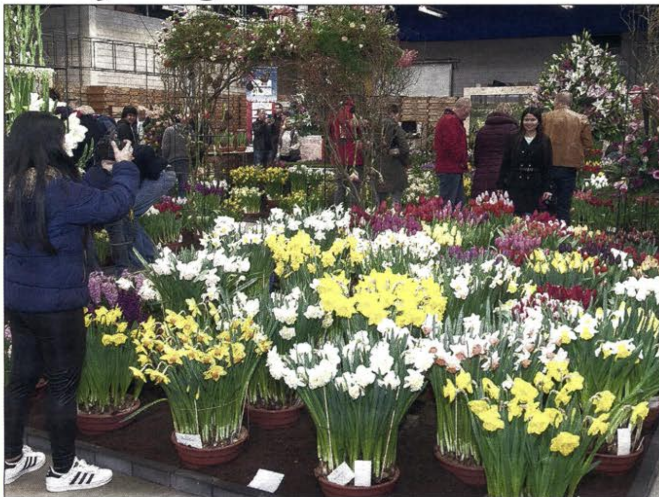
Kleurrijke opstelling van huisbroei- en bloemententoonstelling Lenteflora in het gebouw van Hobaho.